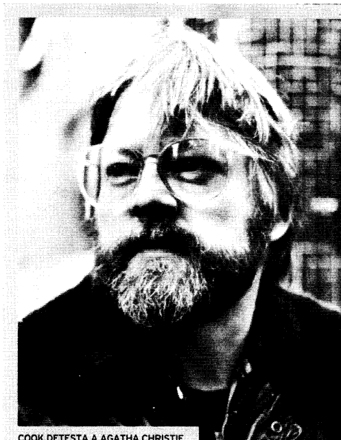
COOK DETESTA A AGATHA CHRISTIE

■ "Es una novela para leerla en las siestas del verano", afirma Thomas H. Cook, autor de Regreso a Breakheart Hill (Umbriel), una historia de misterio ambientada en un pequeño pueblo de Alabama que está siendo un best-seller en Estados Unidos. Cook, que detesta a Agatha Christie -"sus mecanismos de intriga son muy simples"- viajó a nuestro país para promocionar su libro y también para participar en la Semana Negra de Gijón. "Si coges un pueblo, a los habitantes de ese pueblo, colocas un asesinato en medio, y es-